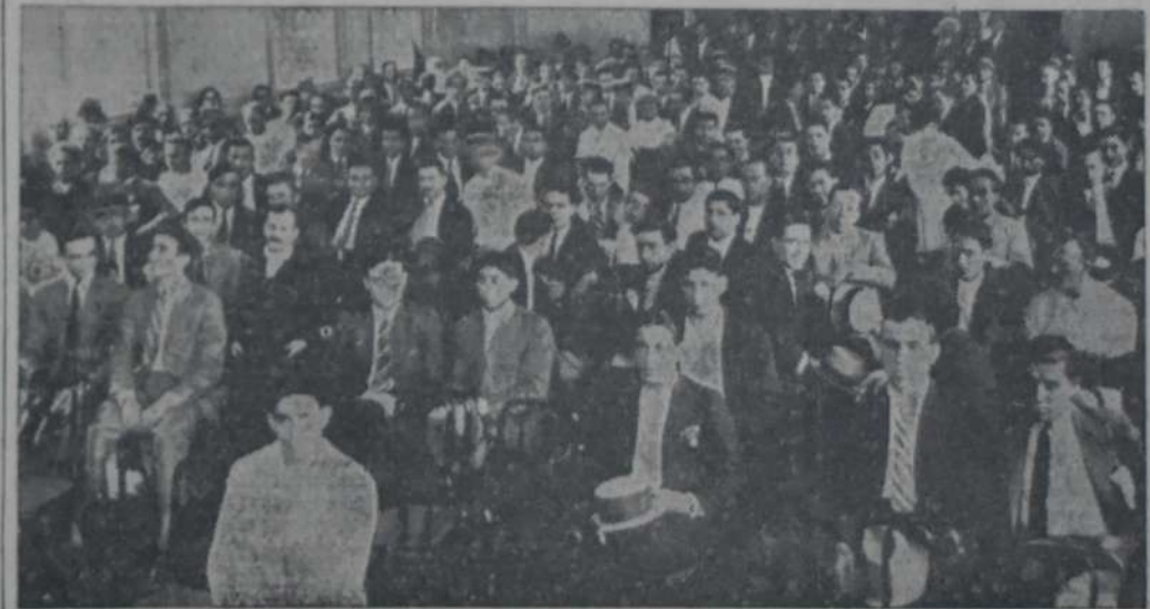
UN ASPECTO DE LA ASAMBLEA DE LOS OBREROS YESEROS REALIZADA AYER EN LA CASA DEL Pueblo.